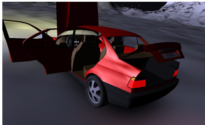
Portes, capot et coffre ouverts