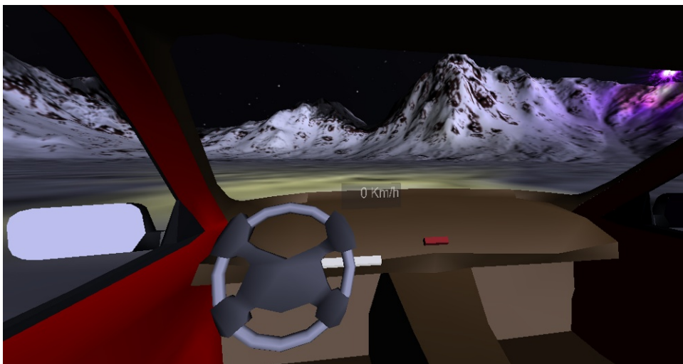
Positionnement par défaut au démarrage