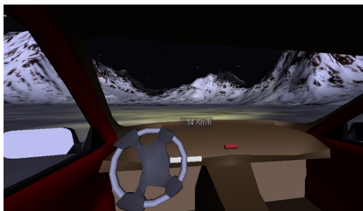
Rotation du volant

Pour tourner, on pourra utiliser le volant de la voiture, utilisant un CylinderSensor .