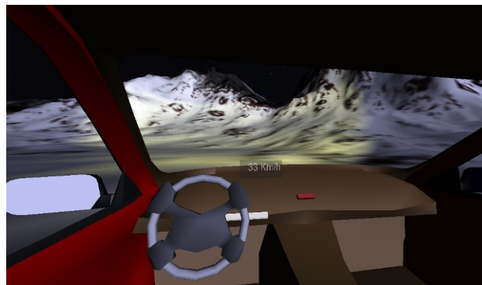
Le compteur de vitesse indique la vitesse de la voiture

Pour se déplacer, on peut, en se plaçant dans la vue du conducteur, utiliser la manette de vitesse située au centre du tableau de bord de la voiture utilisant ainsi un PlaneSensor . Plus la manette est haute, plus la voiture accélérera. Plus la manette est basse, plus la voiture reculera.